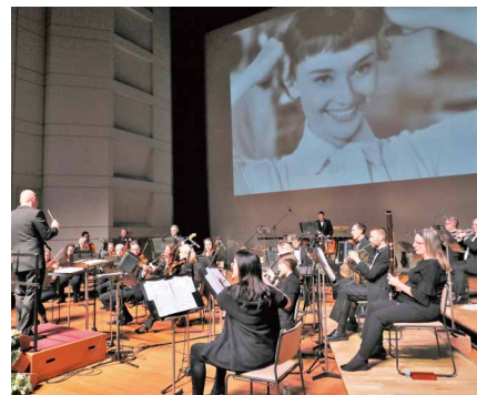
ハリウッド・フェスティバル・オーケストラ