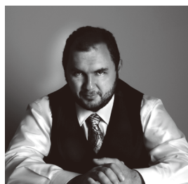
ヴァハン・マルディロシアン

ヴァハン・マルディロシアンが2020年1月よりワロニー王立室内管弦楽団の音楽監督への就任が発表されました!