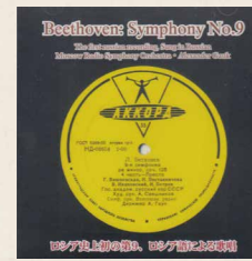
レーベル: Serenade SEDR-2038 アレクサンドル・ガウク指揮 モスクワ放送交響楽団 1952年録音

今とは大きく異なり、まだ親しみが少ない国・時代において、こういった訳詞による演奏が普及の手助けをしたことは紛れもない事実。そんな先人たちによる第九の聖なる精神の表現とその普及の努力に、今宵少し耳を傾けるのはいかがでしょうか。