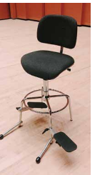
理想のコントラバス椅子

初めての試みとなるこのコーナー、まずはコントラバス用の椅子についてご紹介いたします。楽器の世界だけあってまさにピンキリ、数千円で買えるものから、ベルリンフィルが使用しているものは新卒初任給並みの値段。入団の際に自分用の椅子をオーダーしているプロオケもあるそうですね。来日オーケストラの場合は、バス椅子も本国から輸送するケースもありますが、会館さんで借りすることも多いです。しかし日本のバス椅子が大きな体に合わず、結局立って演奏していることもしばしば…。もしホールのバス椅子を新調する際は、座面の高さが調整出来るもの、スプリングで座面が沈み込まないものを選ぶと喜ばれるかも…?