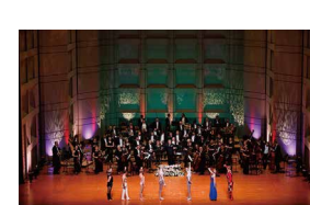
1月公演「シルク・ドゥラ・シンフォニー」

若者と海外観光客に人気の町「渋谷」。人々が行き交う賑やかなスクランブル交差点から「SHIBUYA109」を通り過ぎて、文化村通りをしばらく上って行くと、左の角に東急百貨店本店に隣接する複合文化施設の「Bunkamura」が見えてきます。そして日本最大規模を誇る「シューボックス型」のコンサートホールである「オーチャードホール」が中に入っており、30年間ずっと芸術文化の中心地の一つとして発信し続けています。その舞台にはクラシックコンサートのほか、バレエ、オペラ、そして演劇など、年間を通して多彩なラインナップを上演し、沢山のお客様が訪れています。弊社も数多くの主催公演をここで開催しております。来年1月「シルク・ドゥラ・シンフォニー」、7月「トリニティ・アイリッシュ・ダンス」、そして再来年「ハリウッド・フェスティバル・オーケストラ」などを予定していますので、是非お越しください。コンサート鑑賞の後に、Bunkamuraの「チケット半券サービス」