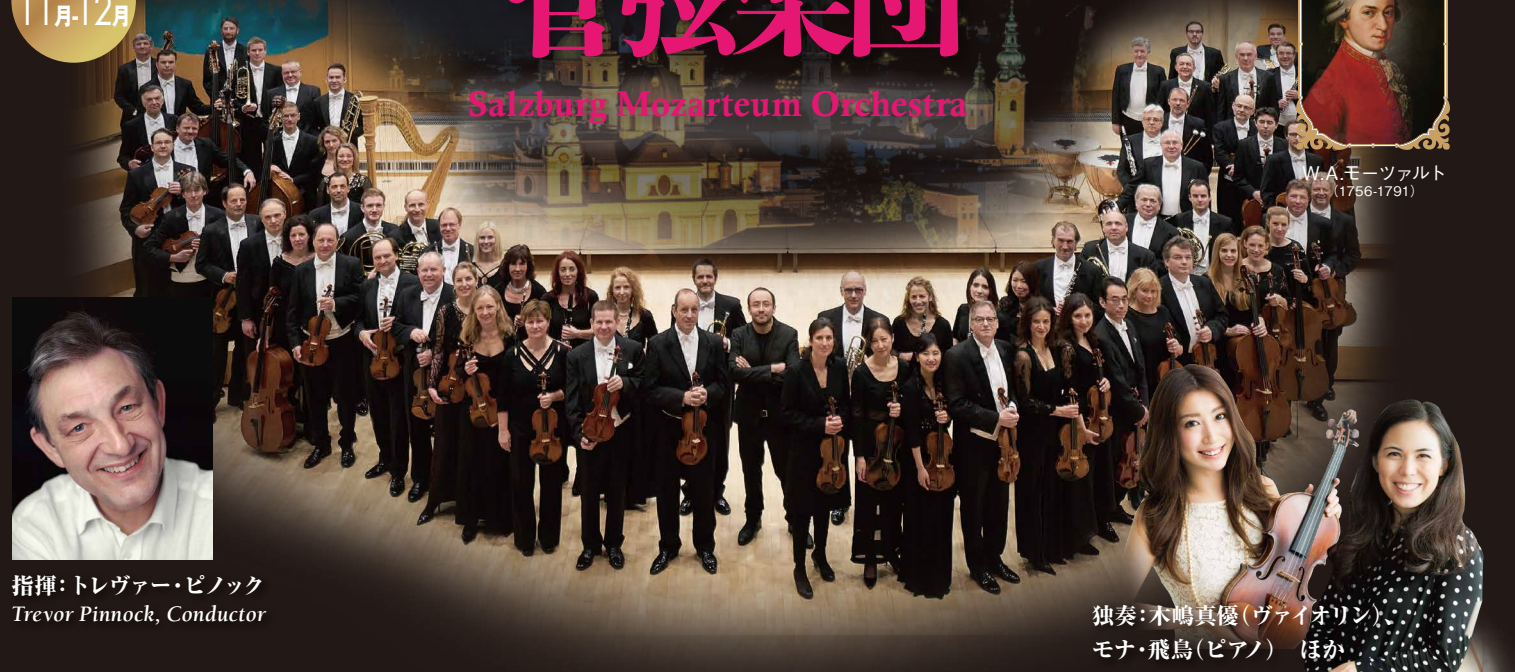
指揮: トレヴァー・ピノック Trevor Pinnock, Conductor