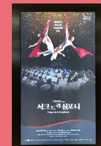
「シルク・ドゥラ・シンフォニー」 韓国公演ポスター

来年1月に来日する「シルク・ドゥラ・シンフォニー」。ツアーに先立ち、10月に韓国ソウルの「ロッテ・コンサートホール」で公演が行われた。その現場に、我々とテレビ東京の取材チームが潜入し、2日間に渡って特番放送の取材を行った。丁度日本に台風19号が直撃した週末で、羽田空港から出発する飛行機が相次いでキャンセルされる中、出演キャスターと取材チームは飛行ルートやスケジュールを変更しながら、何とか全員無事に現地集合。しかしコンサートホールでの取材に思った以上に制限があり、主催者からNG連発の中で、取材チームが機転を利かせ、作戦変更しながら無事に取材を終えた。それにしても驚いたのは、初の韓国公演で「シルク・ドゥラ・シンフォニー」圧巻のパフォーマンスに対してお客さんから盛大に送られた拍手喝采の嵐。その熱気を肌で感じたことは、日本ツアーを迎えるにあたり、大きな励みになった。先日テレビ東の特番も無事放送されて大きな反響を呼んだ。国境を越えて世界を魅了する「シルク・ドゥラ・シンフォニー」の来日公演は1か月後に迫る!北海道から沖縄まで、全国23公演を行う予定。お楽しみに。