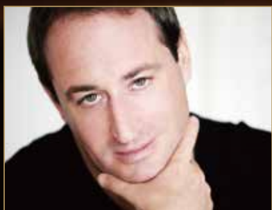
ピアノ：イタマール・ゴラン

クライスラー 愛の悲しみ、美しきロスマリン マスネ タイスの瞑想曲 パラディス シシリエンヌ ブラームス スケルツォ チャイコフスキー メロディ ほか