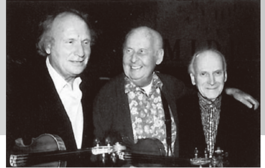
左からギトリス、ステファン・グラッペリ、ユーディ・メニューイン